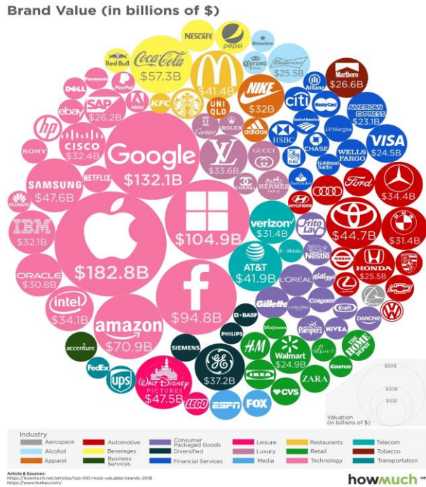
(当今世界最有价值的前100个品牌)